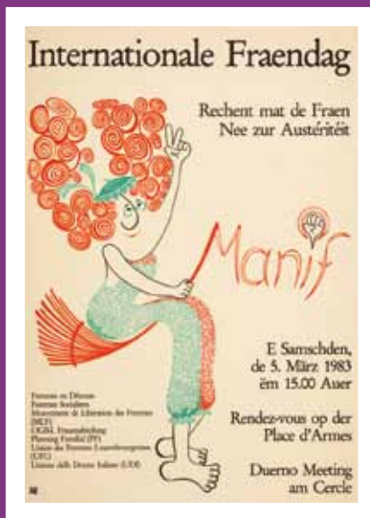
Affiche de mobilisation - 1983 archives MLF - © Cid-femmes